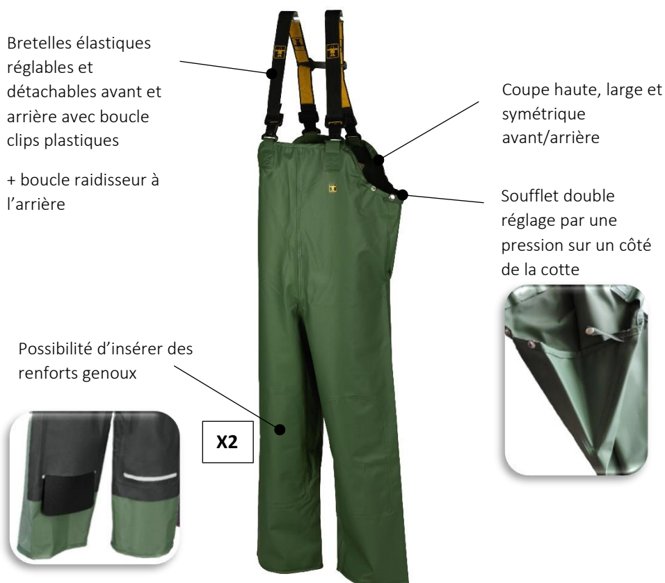
ILLUSTRATION ET MODE D'EMPLOI

EPI = Equipement de Protection Individuelle