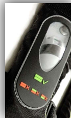
Fenêtre de visualisation du percuteur