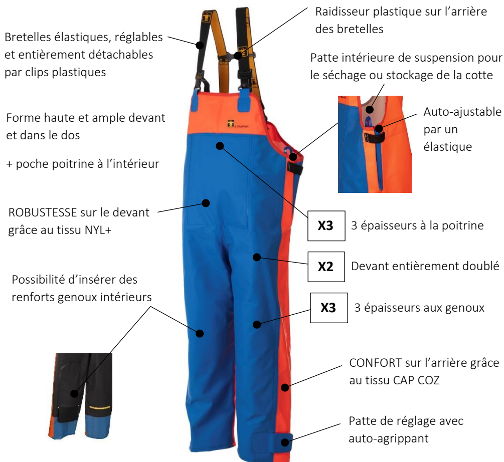
ILLUSTRATION ET MODE D'EMPLOI

i Pour une protection optimale, la cotte X-TRAFORT peut se porter avec une veste, une vareuse ou un manteau classés EPI.