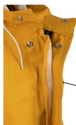
ILLUSTRATION ET MODE D'EMPLOI

Fermeture par boutons pression et glissière grosses mailles