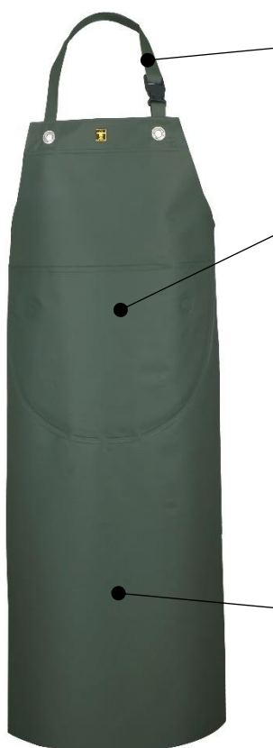
ILLUSTRATION ET MODE D'EMPLOI

S'accroche autour du cou par une lanière tissu réglable par une boucle fermoir plastique