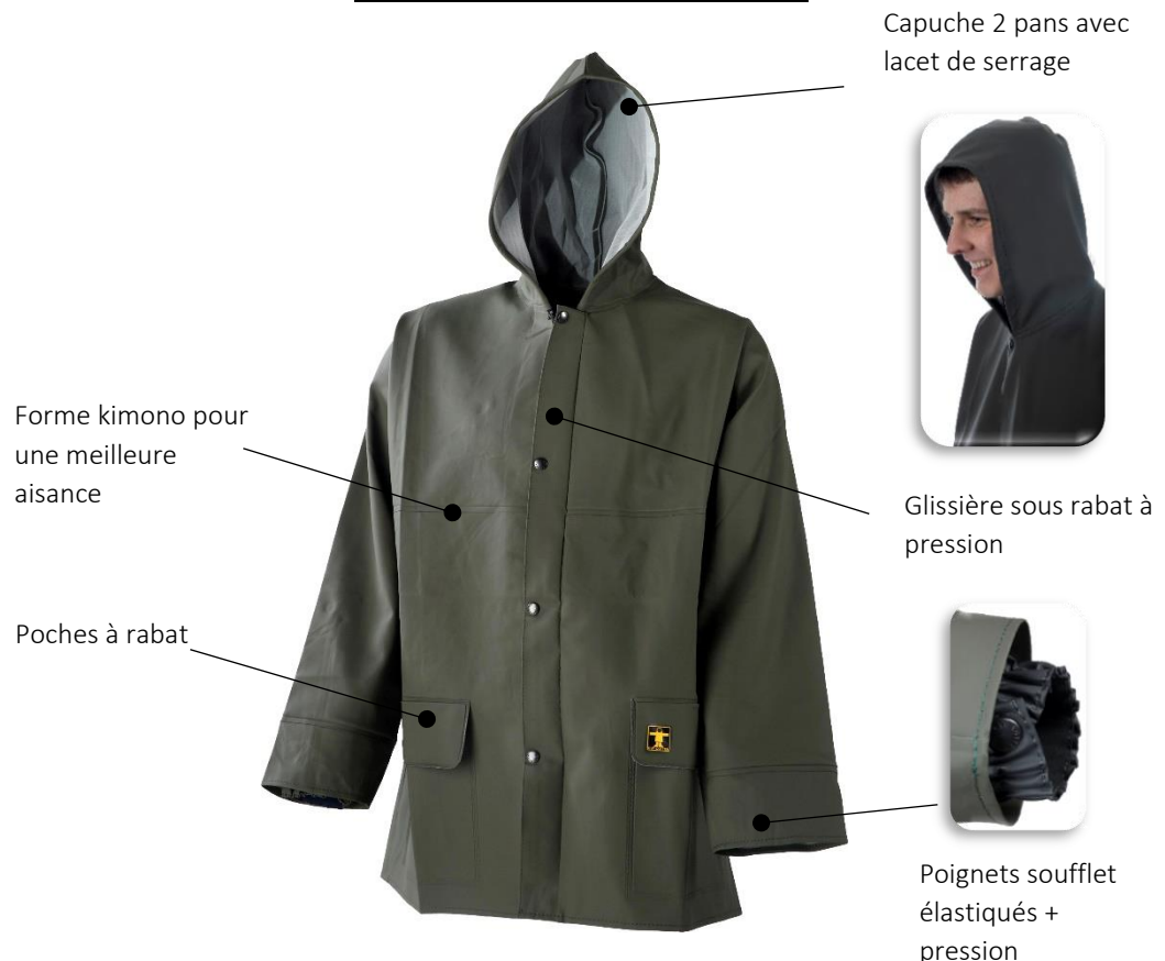
ILLUSTRATION ET MODE D'EMPLOI

EPI = Equipement de Protection Individuelle