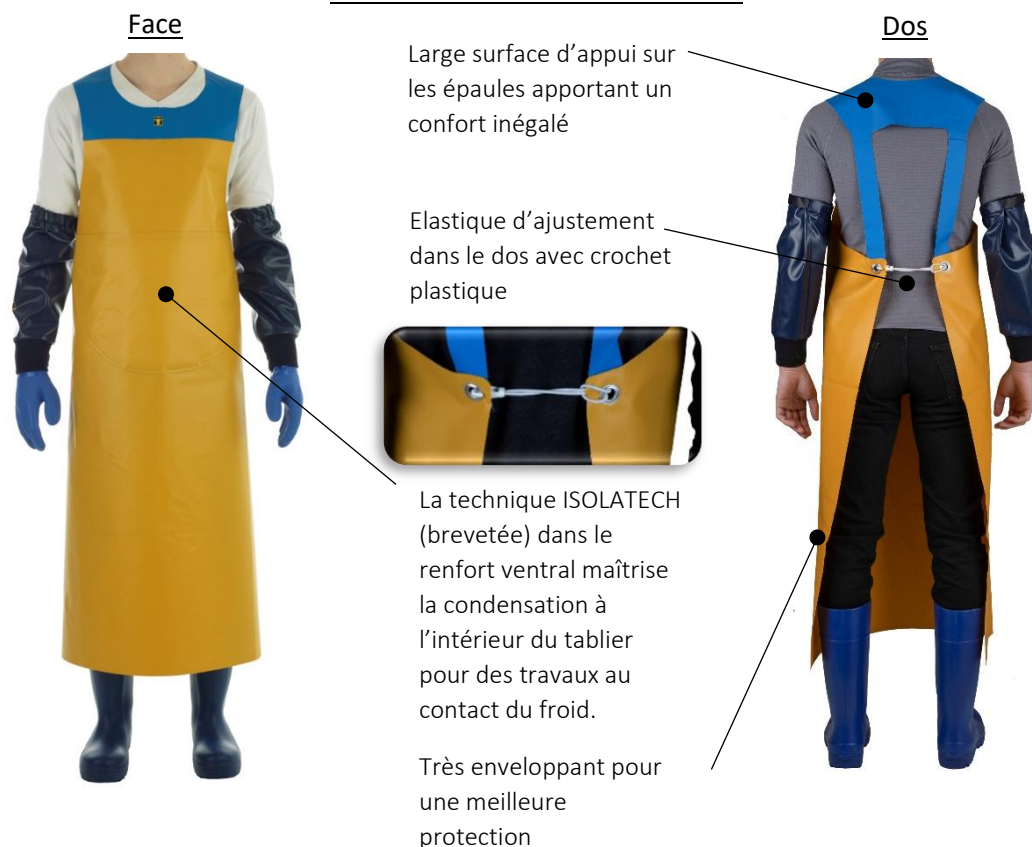
ILLUSTRATION ET MODE D'EMPLOI

EPI = Equipement de Protection Individuelle