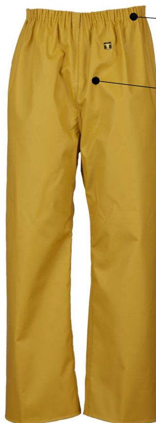
ILLUSTRATION ET MODE D'EMPLOI

EPI = Equipement de Protection Individuelle