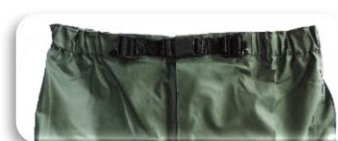
ILLUSTRATION ET MODE D'EMPLOI

EPI = Equipement de Protection Individuelle