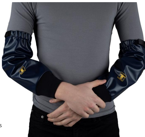
ILLUSTRATION ET MODE D'EMPLOI