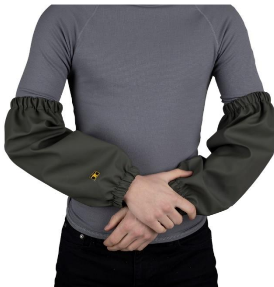
ILLUSTRATION ET MODE D'EMPLOI

EPI = Equipement de Protection Individuelle