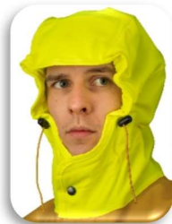
ILLUSTRATION ET MODE D'EMPLOI

Capuche « MAGIC » (brevetée) qui suit les mouvements de la tête